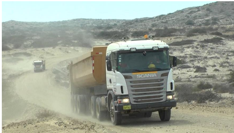
Fig.3 Cola en ruta en una minera X