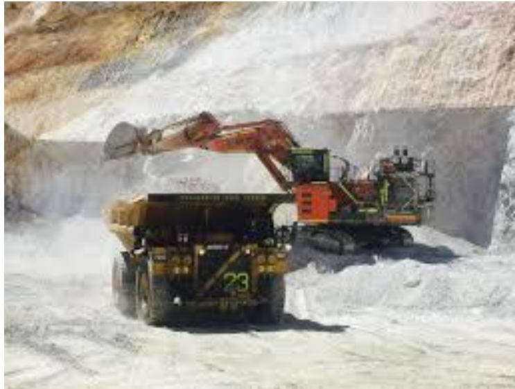
Fig.2 Carguío en una minera X