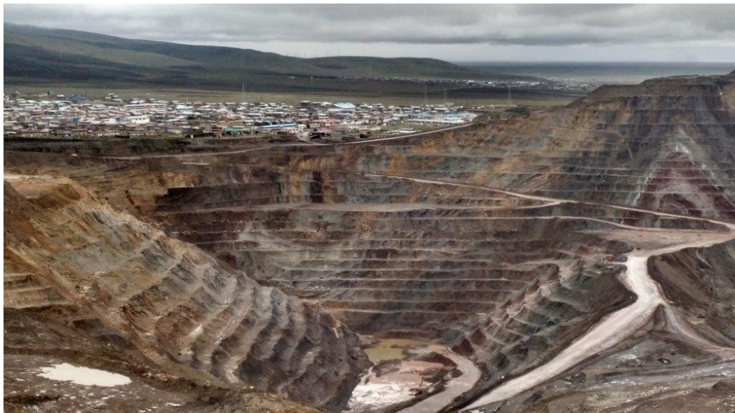
Fig.1 Minera X