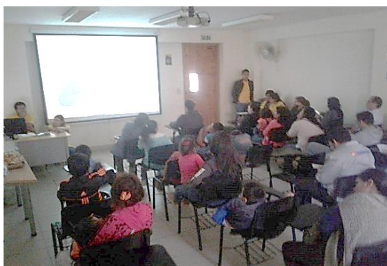
Imagen N° 07: Proyección del documental en UPN