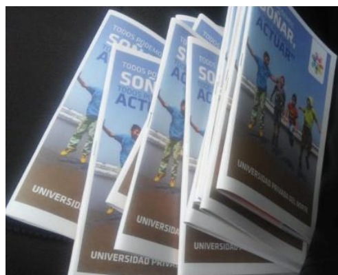
Imagen Nº 06: Contraportada