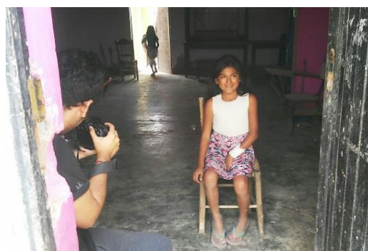
Imagen Nº 03: Entrevistas realizadas a los estudiantes UPN que participaron en el Proyecto Uniones