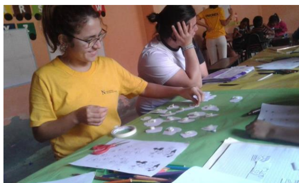
Tabla 5: Desarrollo de dinámicas grupales que promueven la integración y refuerzan el aprendizaje de los niños de la escuela sabatina