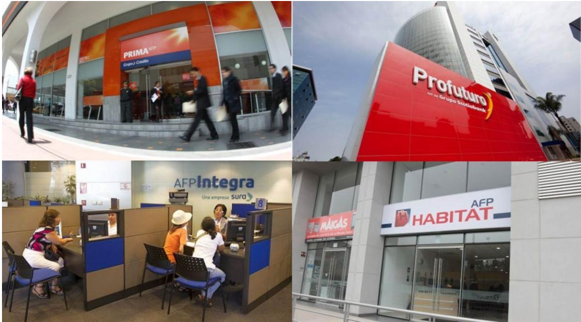
Figura Nro. 2