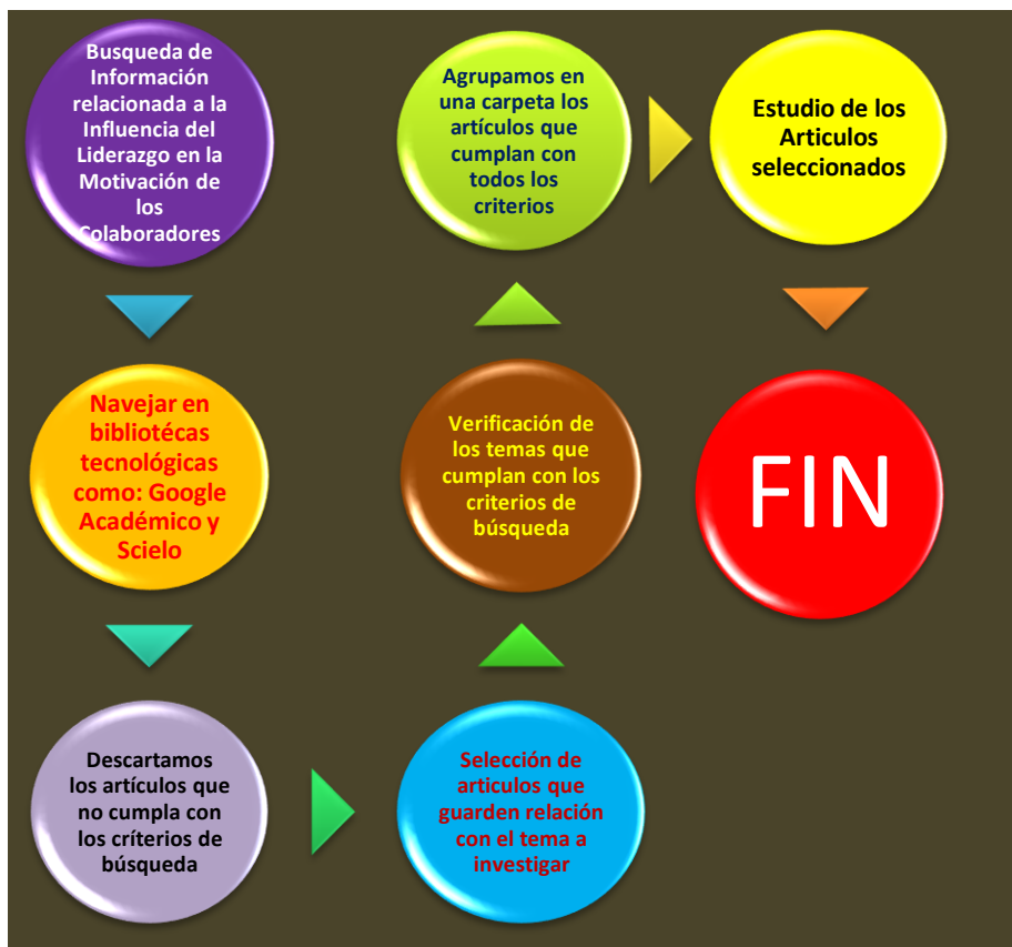
Figura 1: Diagrama de Flujo de la Búsqueda y la Selección de Datos

Uno de los criterios de búsqueda fueron los años, para lo cual se trabajó con los últimos 10 años, del 2009 hasta el 2018. Y como se puede apreciar en el grafico siguiente: