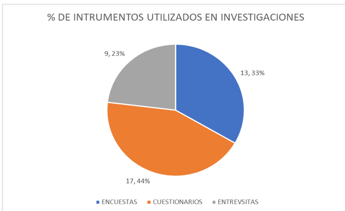
Figura N°2: Porcentaje de instrumentos utilizados en las investigaciones

A continuación, en la figura N°2 se visualizará que tipo de instrumentos se utilizaron para la ejecución de las investigaciones seleccionadas.