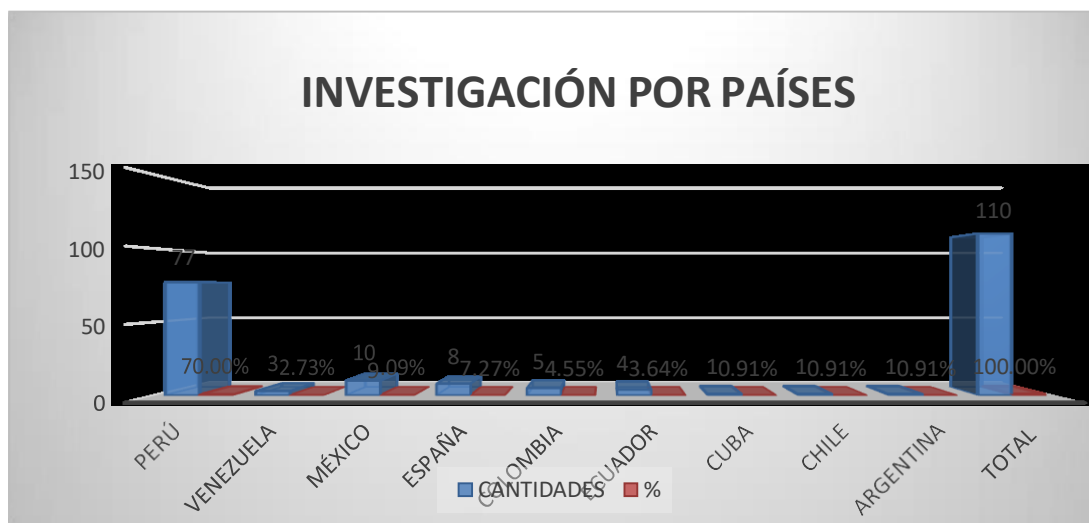
Figura 4: Resultado de investigación por países

Como podemos observar en la figura, se obtuvieron revisiones de literaturas, de fuentes confiables, eso nos permite conocer más profundo el tema y nos muestre una buena información.