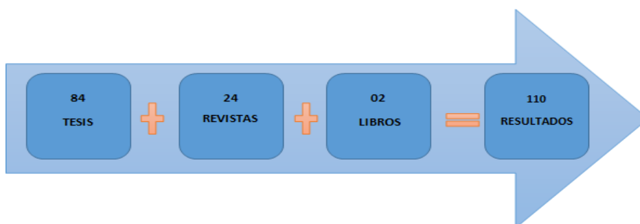
Figura 2: Resultados de la Investigación

La investigación realizada es en base a los artículos científicos como: revistas, tesis y todo documento a la literatura. Pese a la documentación investigada, todo fue en base a la contabilidad y económica. Para tener herramientas y poder ir despejando los problemas identificado, acudimos hacer el uso de los repositorios científicos como en las páginas de: Redalyc, Scielo, Dialnet, Elsevier, Scopus, Cybertesis, Renati y en la biblioteca virtual UPN entre otros repositorios de las Universidades nacionales e internacionales.