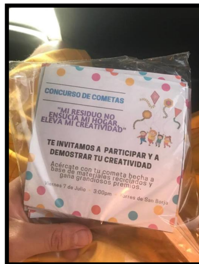
Tabla 04. Programación y planificación de actividades para llevar a cabo el concurso de cometas reciclables.