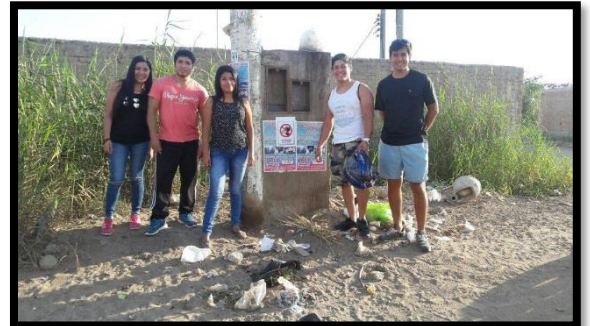
Anexo 5: colocación de banner sobre el cuidado del medio ambiente