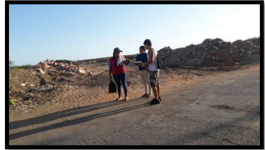
Anexo 3: Grupo de Volanteo de folletos informativos sobre cuidado del medio ambiente