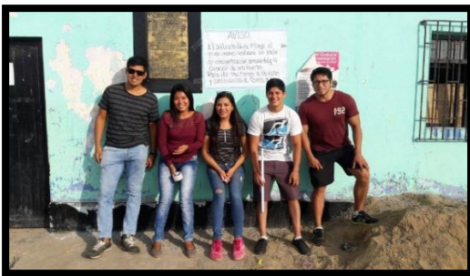
Anexo 2: Volanteo de folletos informativos