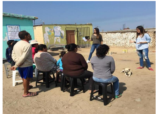
Figura 8: Desarrollo del taller