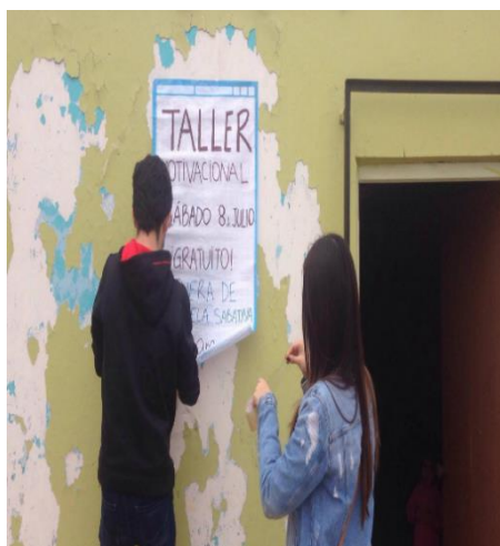
Figura 1: Colocación de papelote