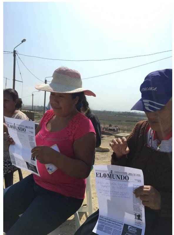
Figura 4: Participación de los pobladores