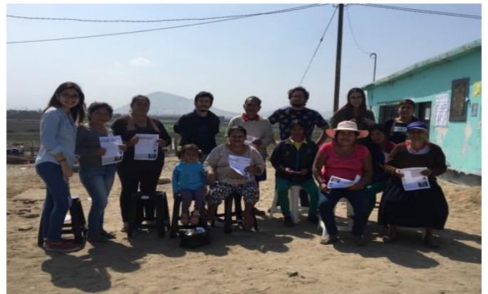
Figura 5: Culminación de taller motivacional