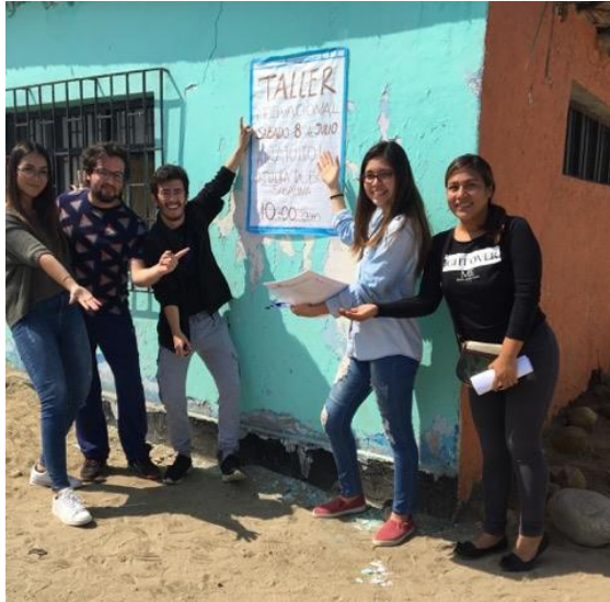
Figura 6: Integrantes del equipo