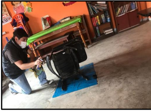
Figura N° 6. Uniformidad del color de las carpetas en las partes inferiores