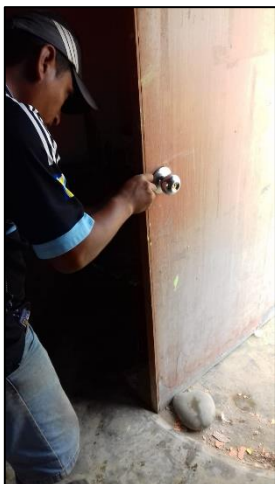
Figura N° 11. Últimos retoques de la fachada de la escuelita