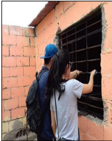
Figura N° 2. Lijada de ventanas