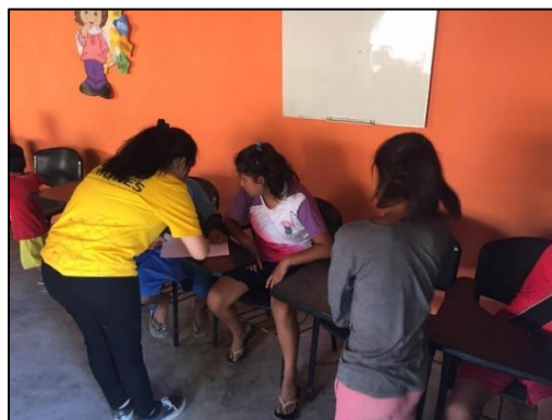
Figura N° 13. Juegos con los niños