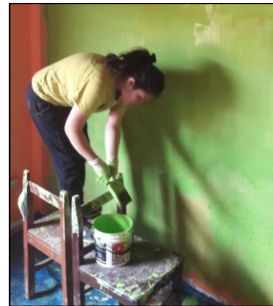
Figura N° 9. Pintado de los laterales de la parte interior de la escuelita