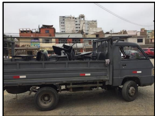
Figura N° 5. Limpieza de las carpetas donadas