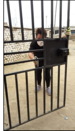
Figura N° 7. Pintada de reja