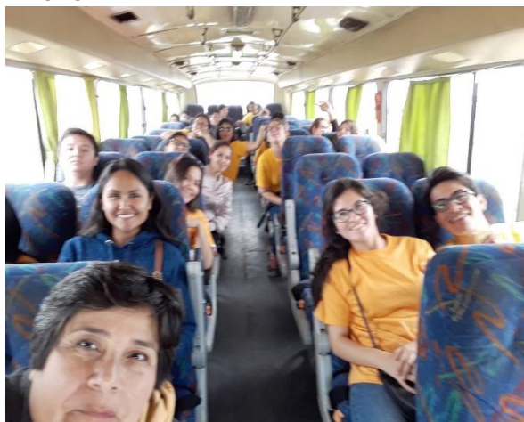
Figura 01: Día de la aplicación del censo, con el apoyo del equipo.