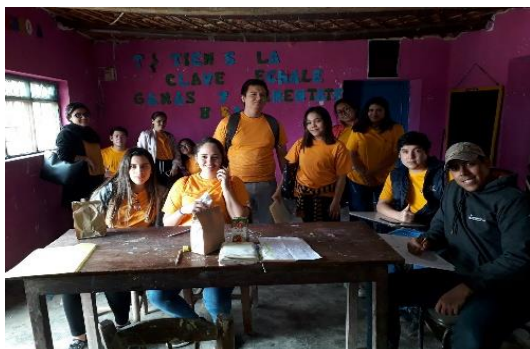
Figura 07: Culminación del censo de manera exitosa.