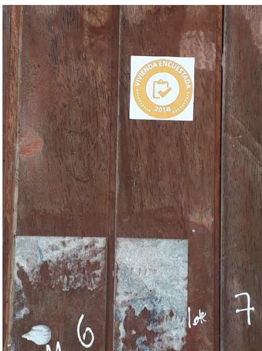
Figura 06: Viandas censadas 2018