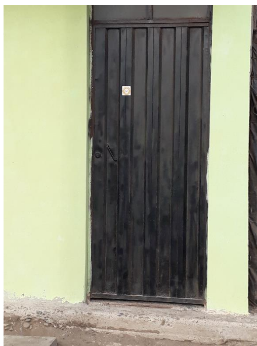
Figura 05: Viandas censadas 2018