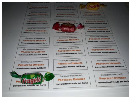
Figura 02: Mensaje de agradecimiento para el encuestado.