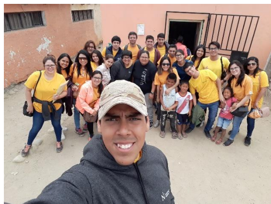
Figura 08: Integrantes del equipo de censo 2018, docentes del CAEF