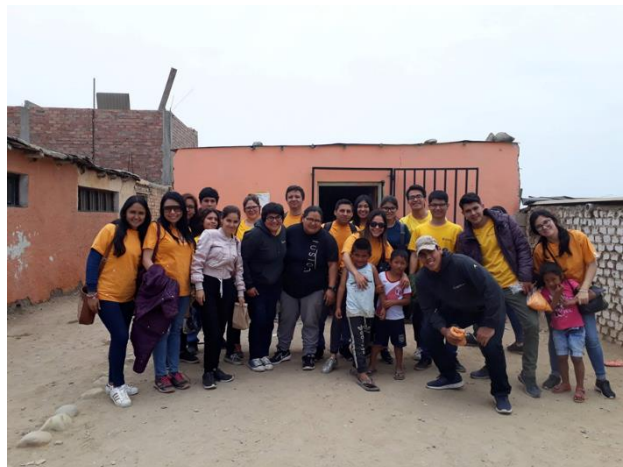
Figura 09: Integrantes del equipo de censo 2018, docentes del CAEF