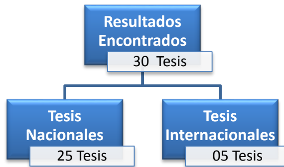
Figura 1: Resultados de la búsqueda.

Las investigaciones fueron elegidas con una previa visualización y según la disponibilidad del archivo. Entonces el resultado fue 30 tesis. Los documentos se clasificaron de acuerdo a la siguiente matriz: