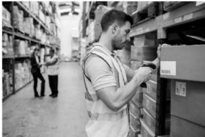
Figura 1: “Realización del inventario físico en el almacén de la empresa a través del registro con código de barra”