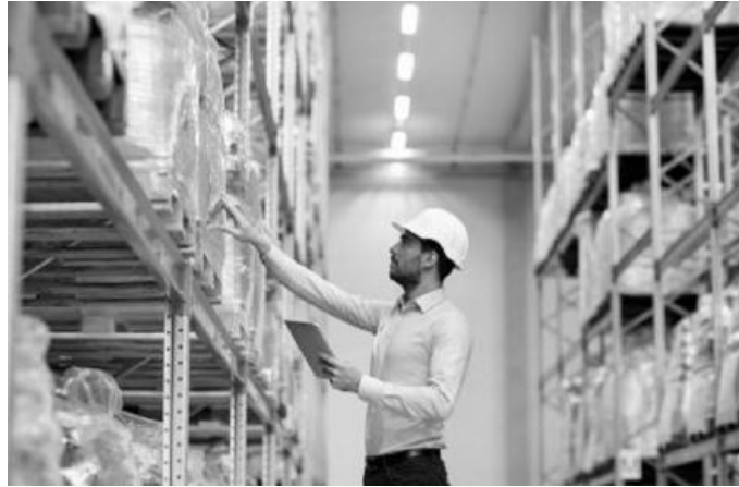
Figura 2: “La realización de inventario podrá de manifiesto los errores en las existencias del almacén”