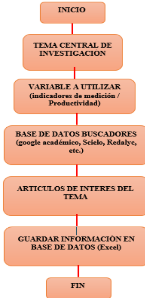
Figura 1. Flujograma de búsqueda de información relacionada con el trabajo de investigación.

este trabajo, así como también se excluyeron 2 artículos cuyos contenidos contenían argumentos no pertenecientes a la industria textil.