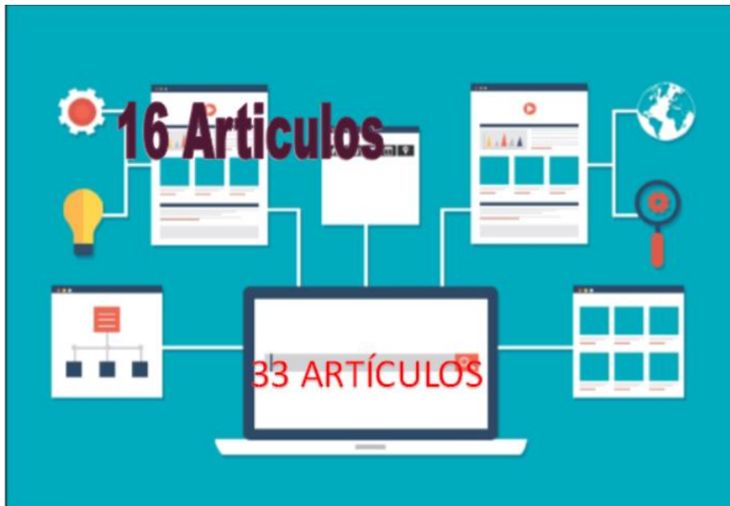
Figura N ° 1. Procedimiento de selección de la variable en estudio

De búsqueda realizada, se obtuvieron como resultado 33(100%) artículos científicos que tratan sobre los sistemas de costos en las empresas, al 100% artículos encontrados se les sometió a un análisis minucioso con el propósito de fidelizar la información de los cuales solo el 48% (16 artículos) cumplieron con los requisitos descritos en los criterios de inclusión, por lo tanto el restante 52% (17) artículos fueron eliminados del estudio por los siguientes criterios: el 15% (05 artículos) no contemplaban la variable sistemas de costos, el 18% (06 artículos) no se aplicaron en empresas latinoamericanas, el 12% (04 artículos) fueron publicados fuera del rango en evaluación y el 6% (02 estudios) se eliminaron por que no eran artículos de revista. En consecuencia, la base de estudio se compuso por trece (16) artículos científicos.