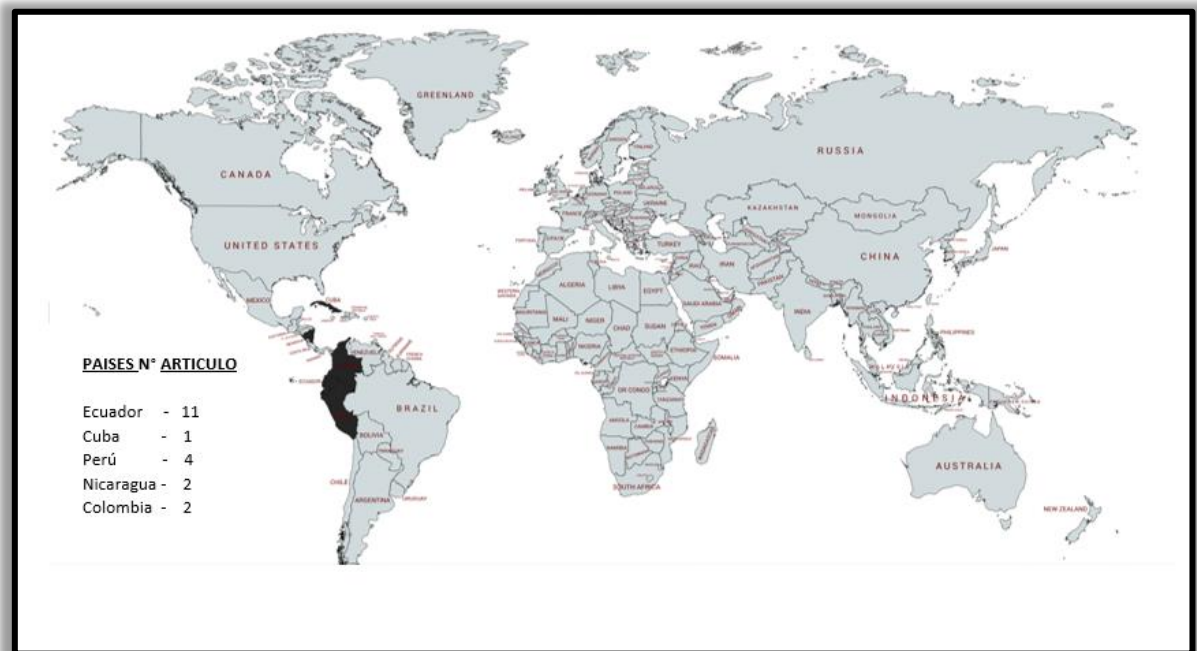
Figura 3 Ubicación Geográfica de los países a los que pertenecen las universidades referenciadas en el estudio

Comentario: La tabla 1 muestra la relación de universidades referenciadas en los artículos Científicos estudiados en función a su naturaleza, país de procedencia, revista indexada, autor y año de publicación.