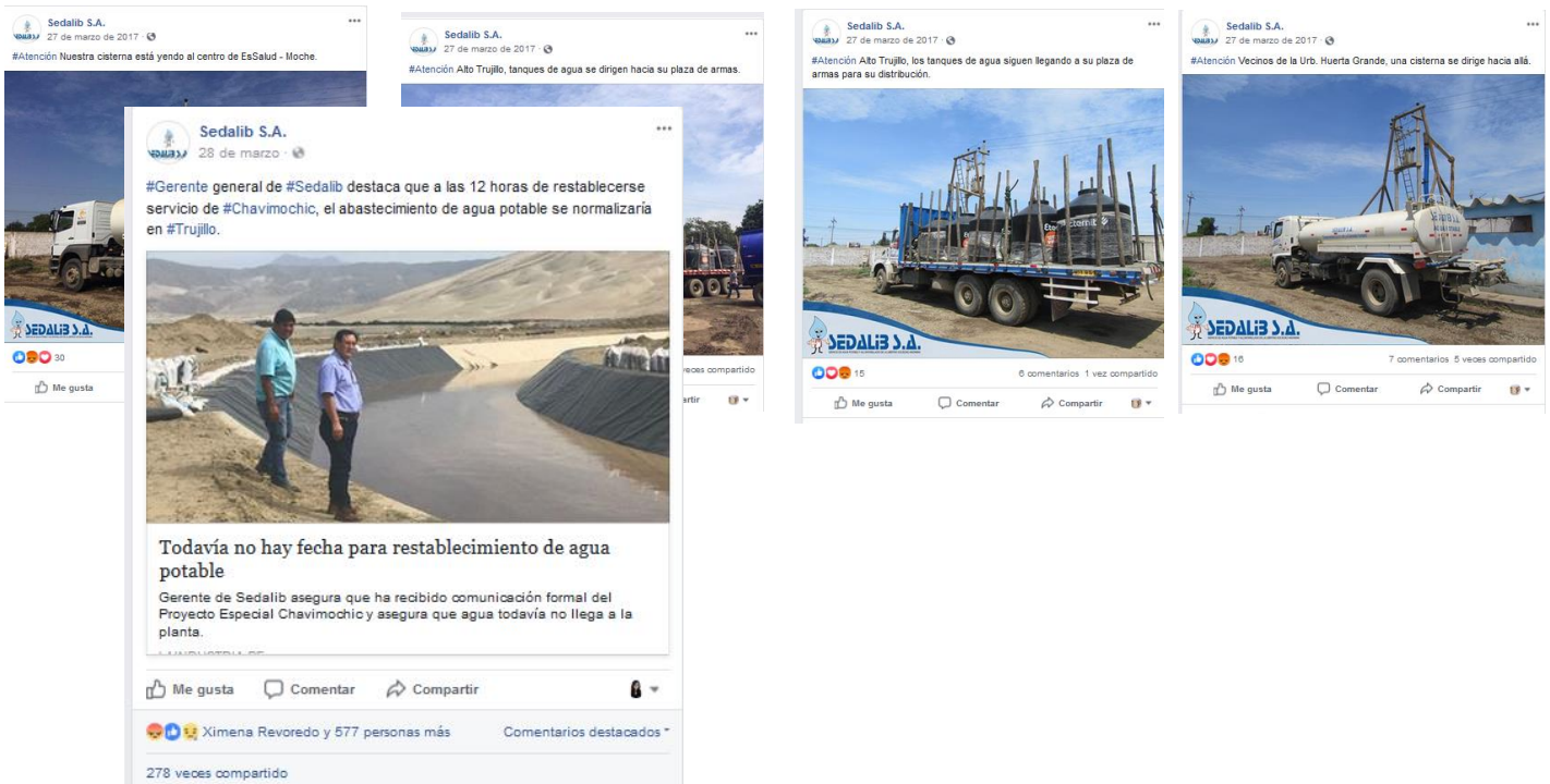
Anexo N° 11 - Información N° 9: