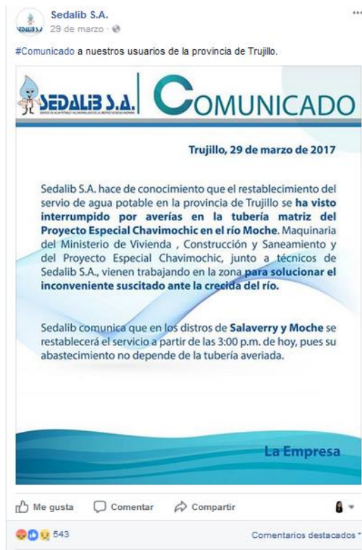
Anexo N° 12 - Información N° 10: