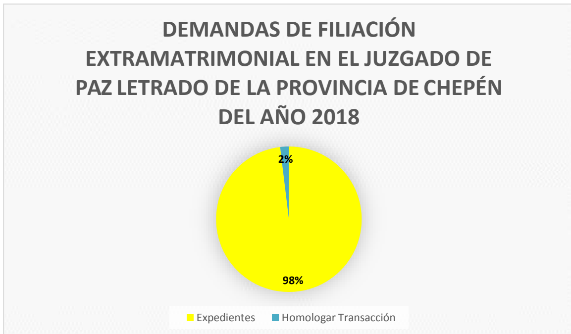
FIGURA N° 7

De 51 expedientes de muestra el 4% representa a los procesos con conciliación, procesos en los cuales no se podría determinar si se ha generado una vulneración del derecho a la identidad del demandante al aplicar la figura de presunción de paternidad por no haber una objeción de la parte demandada por aceptar la sentencia a una filiación extramatrimonial.