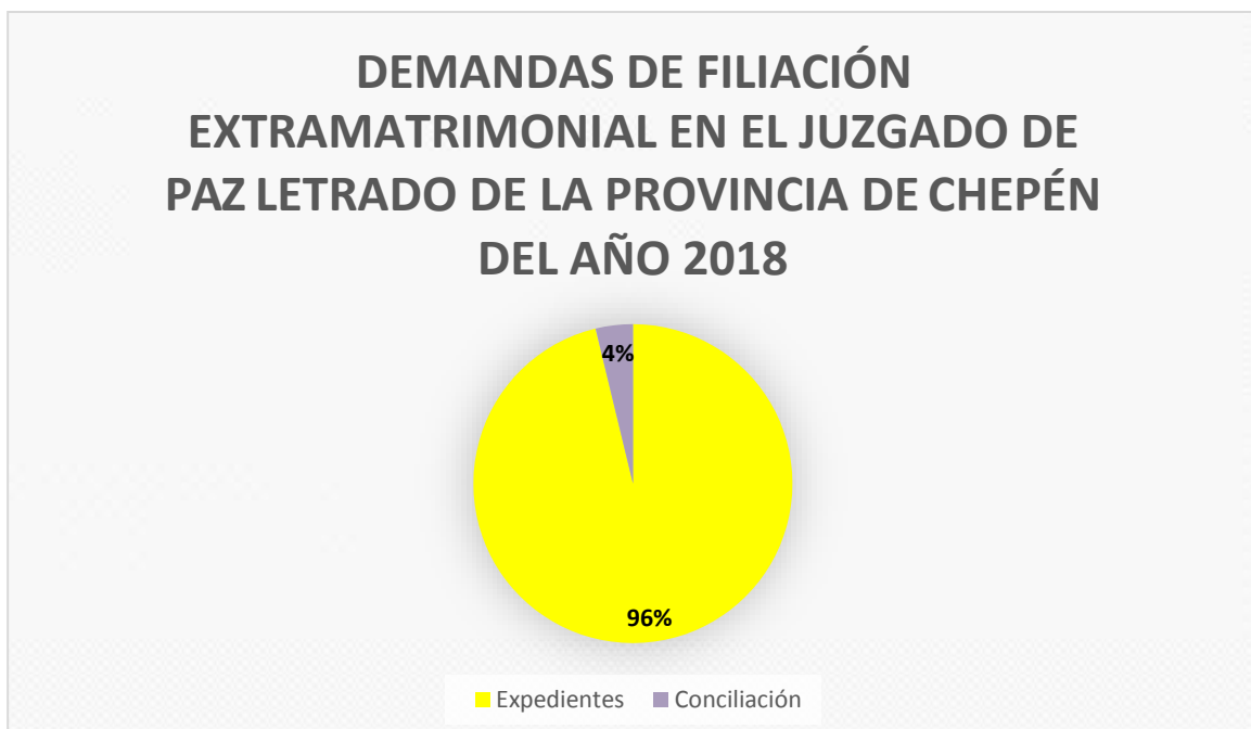
FIGURA N° 6

De los 51 expedientes de muestreo el 6% de demandas se declararon inadmisibles por no contrar con los requisitos esenciales requeridos por la norma.