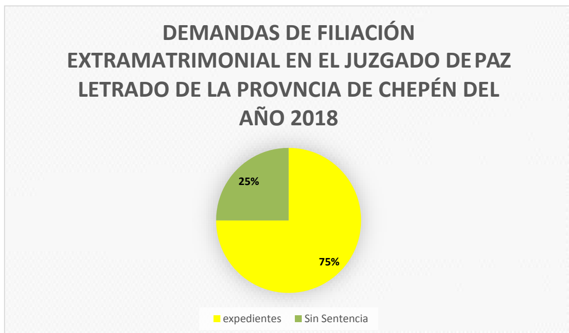
FIGURA N° 2