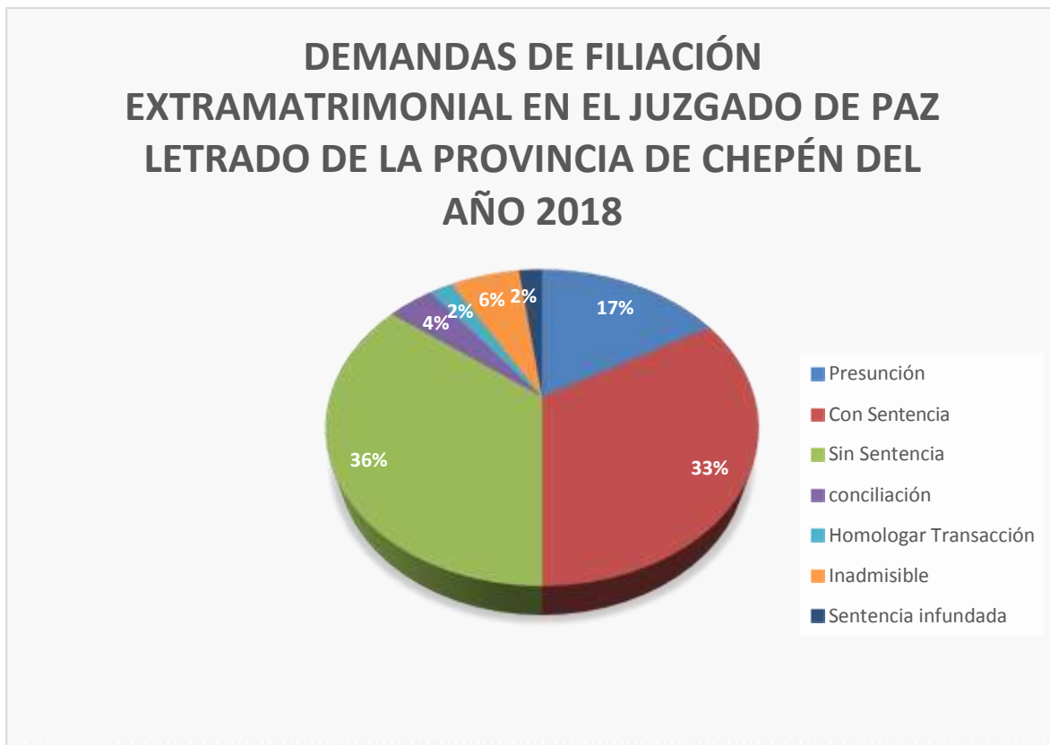
FIGURA N° 1

Cuadros Estadísticos Sobre Procesos de Filiación Extramatrimonial en el Juzgado de Paz Letrado de la Provincia de Chepén