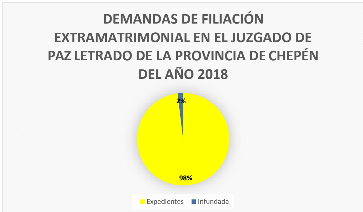
FIGURA N° 8