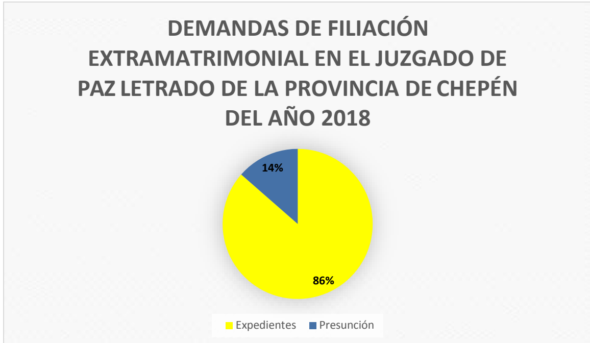
FIGURA N° 4