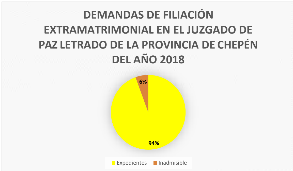
FIGURA N° 5