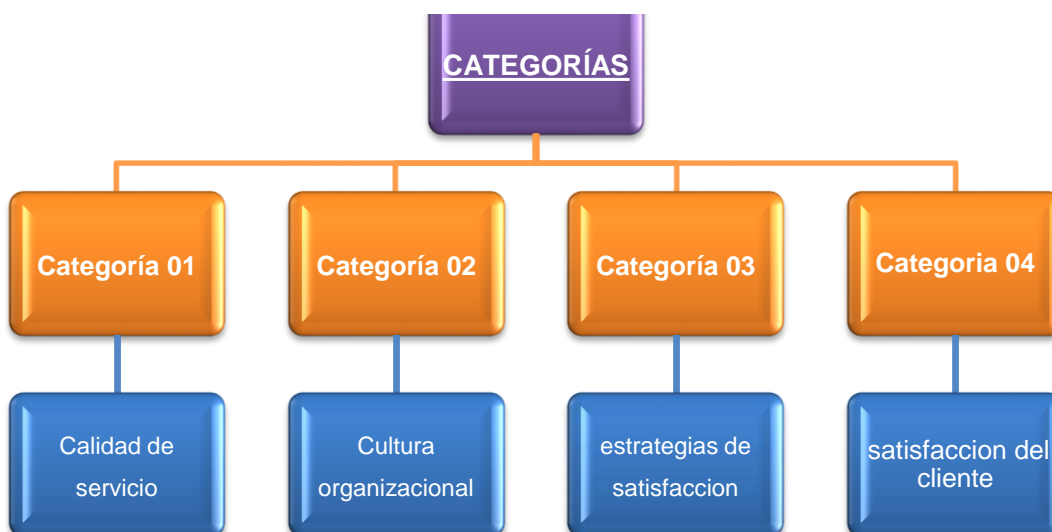
Ilustración 1 Figura de categorías MOIC

Así pues, cada una de esas categorías asignadas tiene su nombre como: calidad de servicio, cultura organizacional, estrategias de satisfacción, satisfacción del cliente y fueron sacadas de un libro. Simultáneamente, cada cita se parafraseó (primer grupo, dos; segundo grupo, dos; tercer grupo, cuatro, cuarto grupo; dos) y se adjuntó todos los parafraseados con sus conectores. Para finalizar; si es un solo autor, se puede hablar en futuro porque se explica al autor o se redacta en pasado para complementar lo que está diciendo el autor. Es por eso que el primer párrafo sintético viene a ser solamente de un libro entonces se ha tenido que redactar en pasado para poder relacionar lo que está diciendo el autor del libro y ahí finaliza el texto sintético.