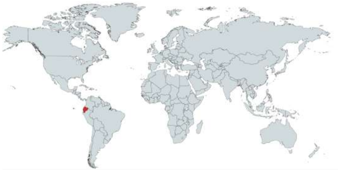
Figura 3 Ubicación Geográfica de los países a los que pertenecen las universidades referenciadas en el estudio

Comentario: La tabla 1 nos permite ver la relación de universidades referenciadas en los artículos Científicos estudiados en función a su naturaleza, país de procedencia, revista indexada, autor y año de publicación.