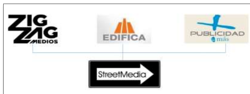
Figura n.º 1: Empresas Fusionadas Street Media S.A.C.

Esta empresa cumple con su principal Misión, que es brindar las mejores ubicaciones para sus clientes; y lograr que sus marcas tengan el mayor impacto posible en su público objetivo. Asimismo, busca ser eficaz y eficiente con sus clientes, dándoles flexibilidad y seguridad de que todos sus requerimientos se cumplirán con la rapidez y calidad que buscan.