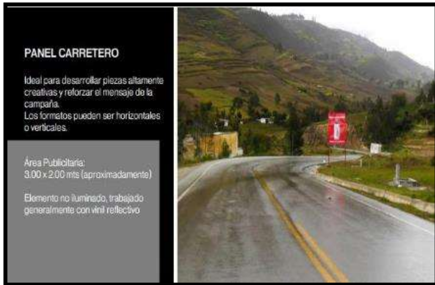
Figura n.º 6: Panel carretero