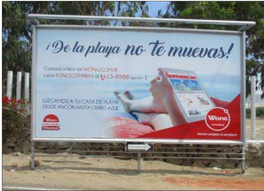
Figura n.º 4: Pórticos