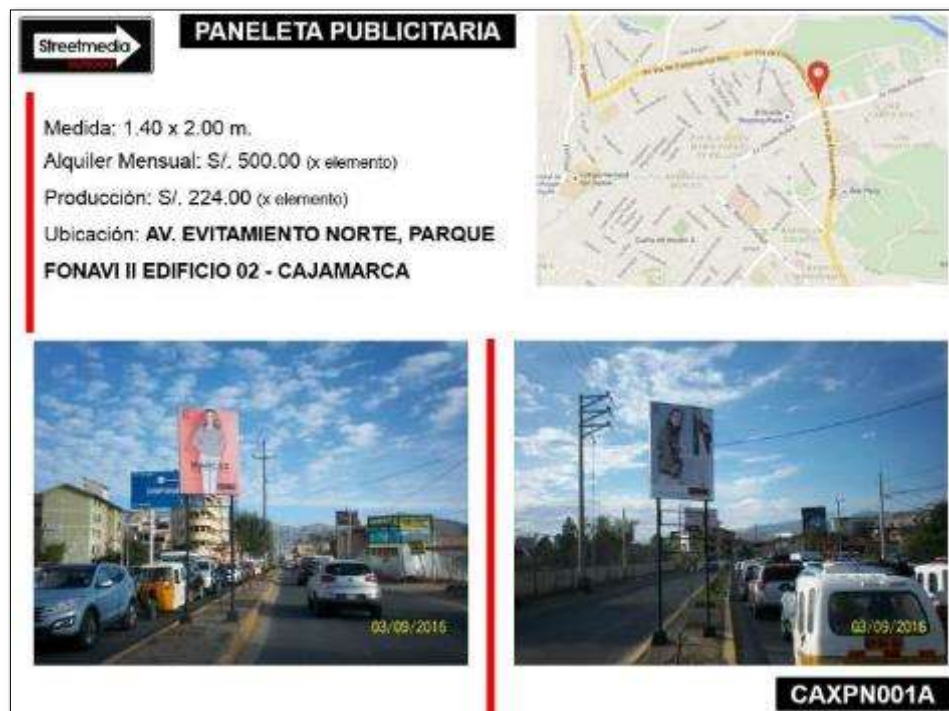
Figura n.º 7: Paneletas