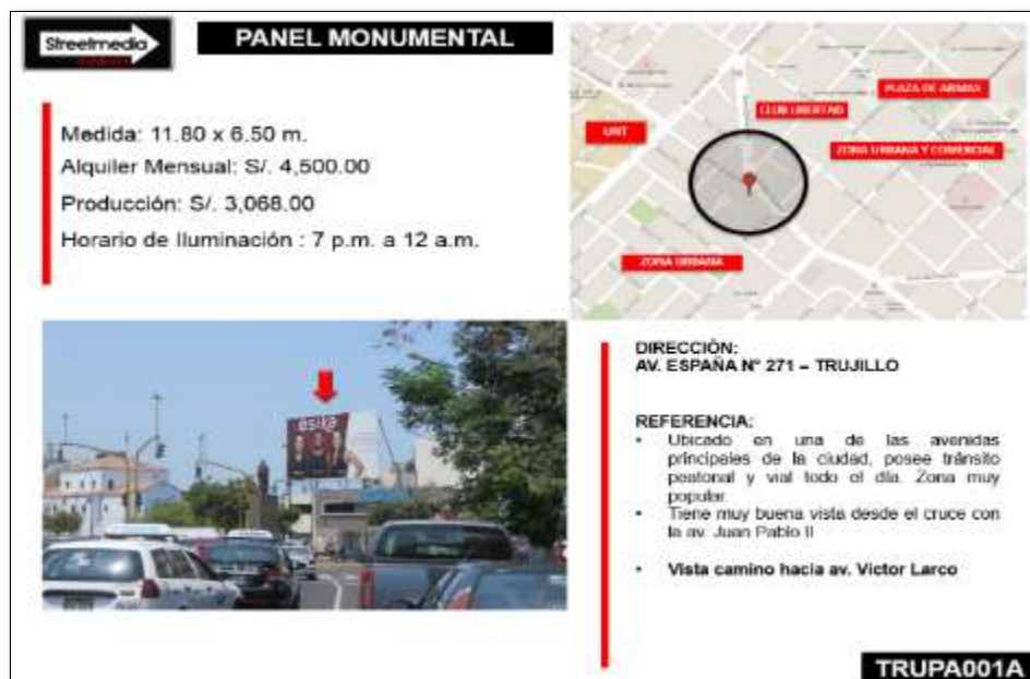
Figura n.º 3: Torres publicitarias