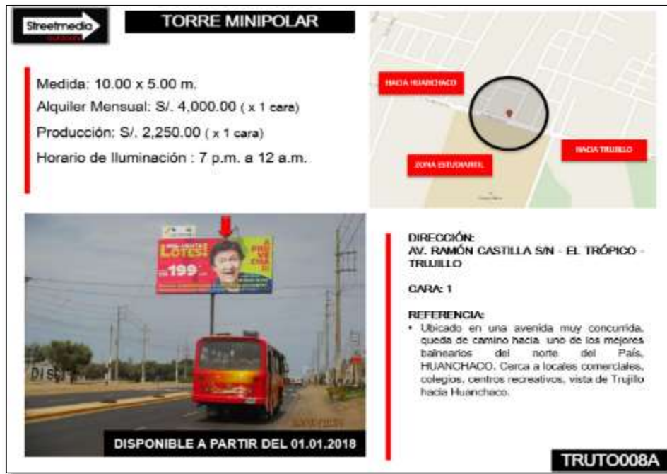
Figura n.º 2: Paneles