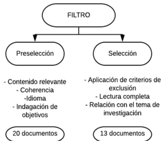
Figura 2: Etapas para la selección final