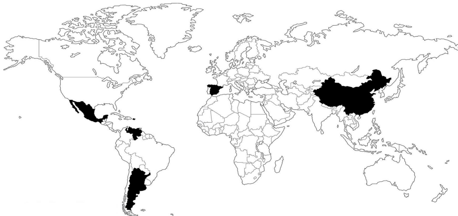
Figura 2. Los países resaltados son de donde provienen los artículos científicos

Los países que figuran sombreados son: México, Puerto Rico, Venezuela, Argentina, España, China. Estos países son los principales lugares que aportan información para la elaboración de nuestra investigación; cabe resaltar, que la mayor información se encuentra en idioma español, lo cual permitió que su revisión sea más fácil.