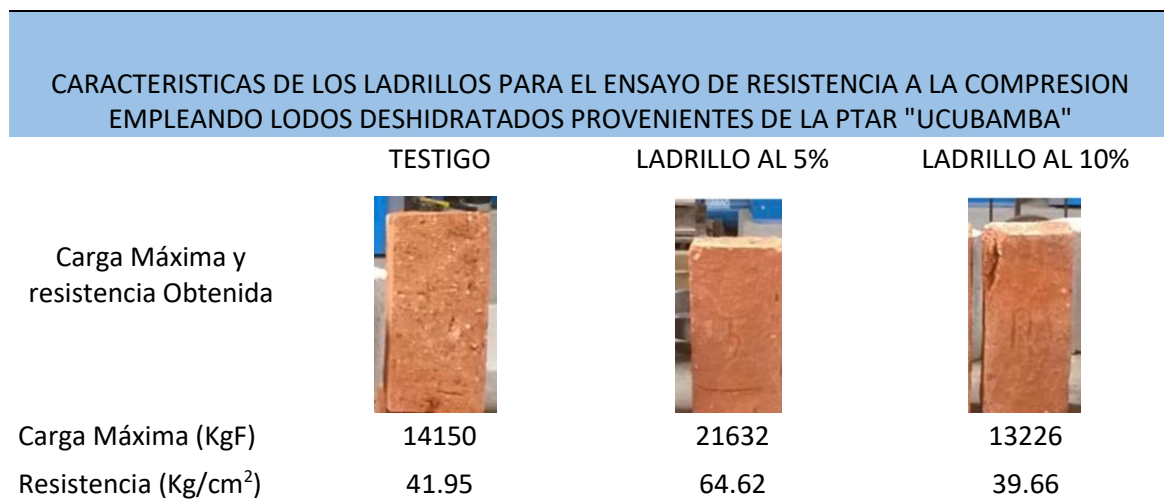
Tabla N° 08 Resultados de la Resistencia a Compresión de Ladrillos LDU

PROYECTO "Aprovechamiento de lodos deshidratados generados en plantas de tratamiento de agua potable y residual como agregados de materiales de construcción"