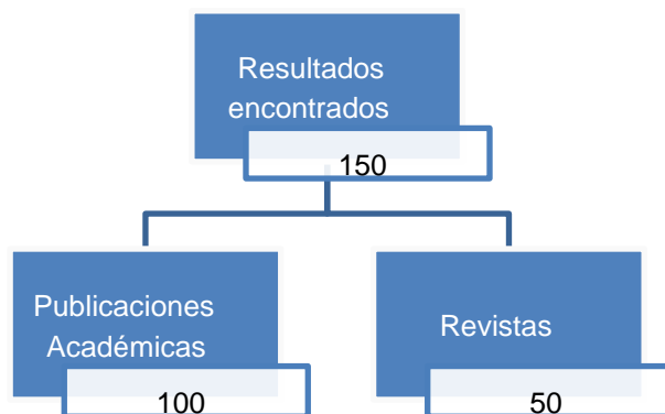
Figura 2: Resultados de la búsqueda de información