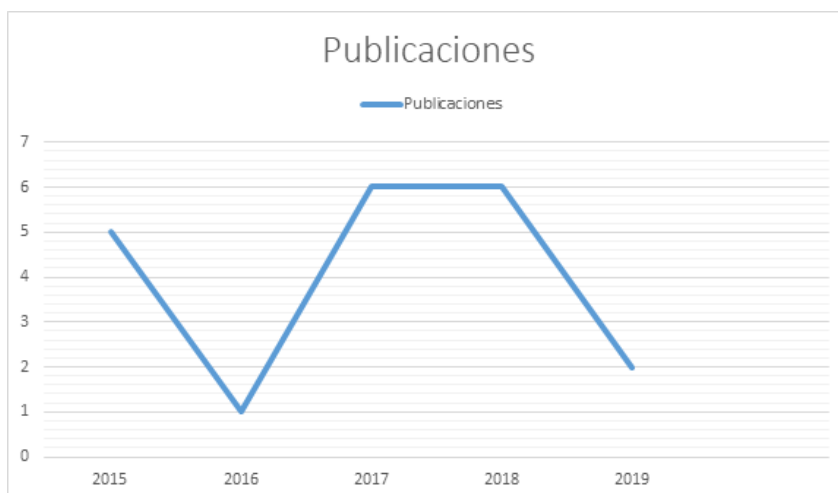
Figura 2: Tendencia de los estudios, según el año de publicación en los países de Hispanoamérica del 2015 al 2020

En la tabla 2, se observa que en España se han hallado 13 artículos del 2015 al 2019 teniendo la mayor cantidad de publicaciones hasta la fecha, luego tenemos a Costa Rica con 1 artículo en el 2019 y México con 1 artículo en el 2018. Asimismo en Suramérica tenemos que Colombia realizó de 3 publicaciones del 2015 al 2017 y Perú con 2 artículos entre los años 2017 al 2018.