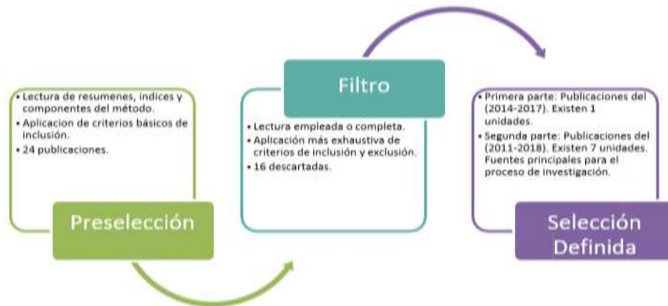
Figura 1: Etapas para la Selección De La Muestra

La Figura 3 da a conocer el proceso de búsqueda así como los criterios de inclusión/exclusión contemplados. Se utilizó una técnica de exploración bibliográfica en bola de nieve haciéndose uso de descriptores (palabras clave) y operadores lógicos (and, &, or, not).