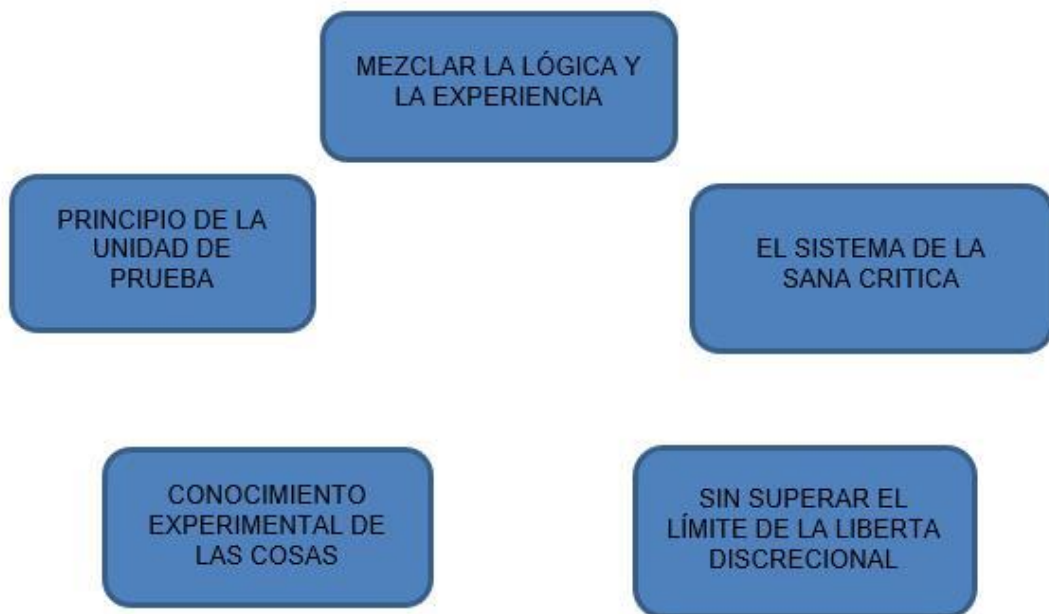
Figura 3. Relación de un medio probatorio con la violencia psicológica, elaboración propia (2021).

medios probatorios están sujetos a regla de la sana critica, de no ser así, significa que se estaría vulnerando el sistema de valoración probatorio, en tal sentido dependiendo la calidad de lo que se concluya, podrá lograr el convencimiento del juez, o de no tener indicios contundentes, se exigirá algún nuevo aporte o medio probatorio que ayude a determinar una afectación psicológica en un integrante del grupo familiar.