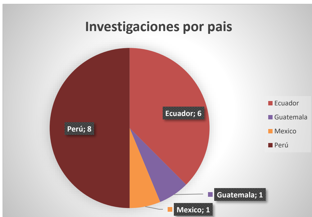
Figura 3: Distribución de investigaciones por país

En base al análisis de datos considerando a los criterios de búsquedas establecidos, se obtuvo un total de 16 documentos de investigación, de los cuales se evidencia una mayor cantidad de documentos de investigación en el año 2018 y mayor énfasis de investigación en Perú.