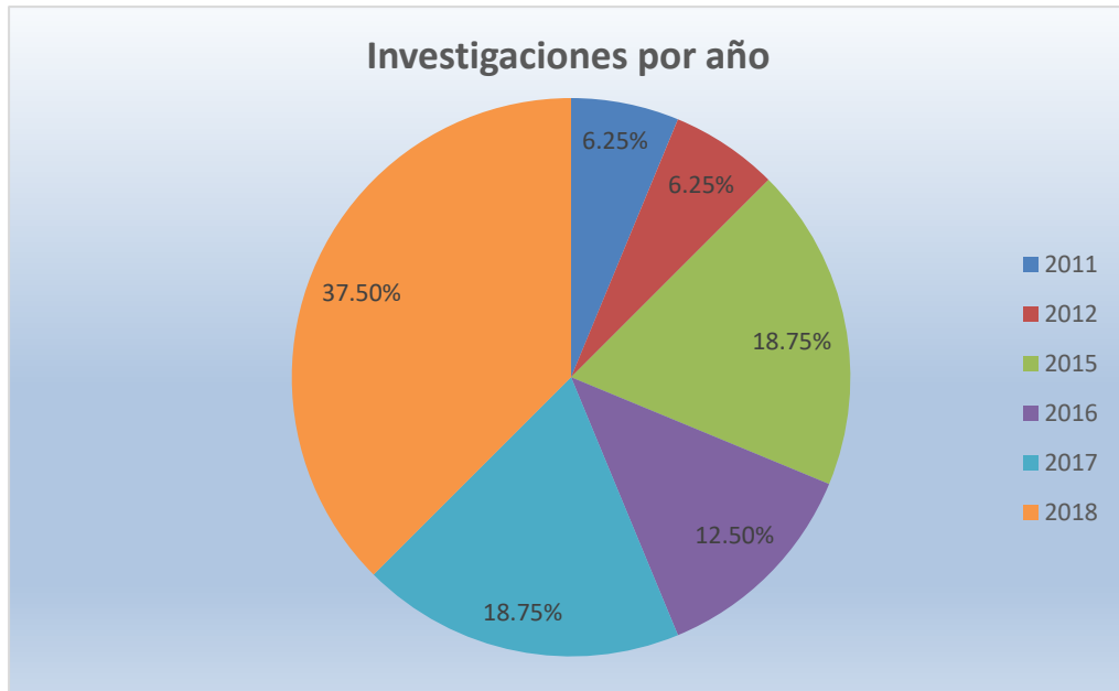
Figura 4: Distribución de investigaciones por año de publicación