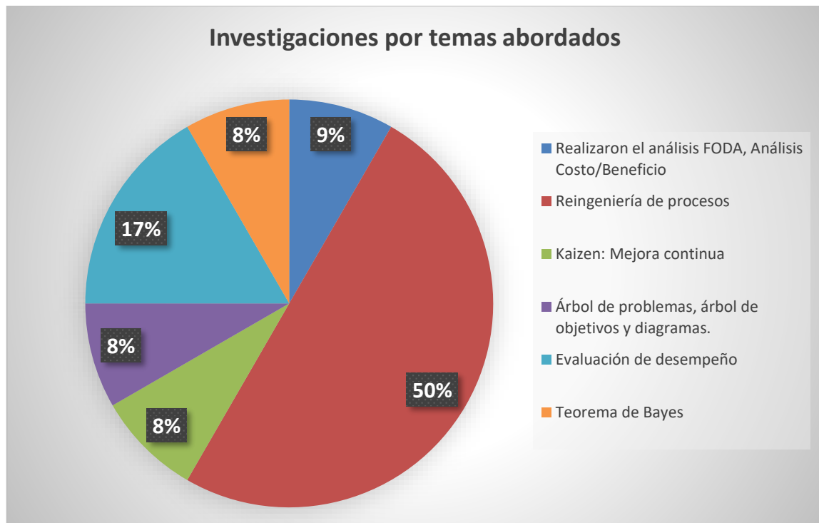
Figura 5: Distribución de investigaciones por temas abordados

Y según la información brindada, se determina que el método más usado es la Reingeniería de procesos ocupando un 50% de la totalidad.