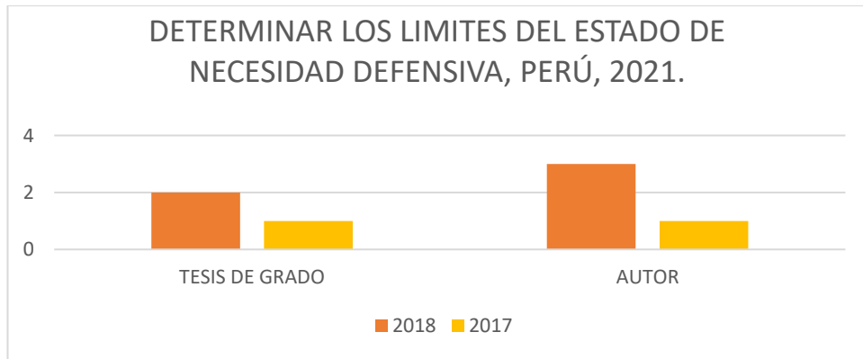
Figura 3: objetivo específico 2.

En el gráfico se aprecia el año de las tesis de grado y autor, tesis empleadas para el desarrollo del presente trabajo de investigación, los cuales responden a nuestro objetivo específico 2, que fueron escogidos por la relevancia e importancia sobre el estado de necesidad defensiva.