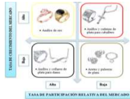
Fig.3. Matriz BCG Elaboración propia

Según la matriz BCG de la Figura 3 se define cuatro tipos de categorización de productos de negocio: