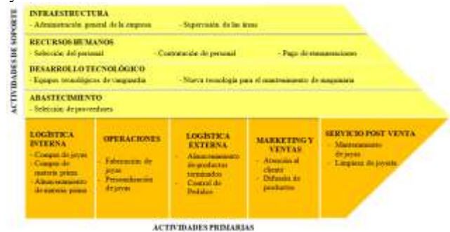
Fig.5. Cadena de Valor Elaboración propia

Con respecto al análisis de la cadena de valor , se detalla en la Figura 5, en donde las actividades primarias corresponden a la compra de materia prima para su fabricación, posteriormente son almacenados hasta que se efectúen los pedidos la difusión de la misma. Finalmente, la empresa tiene como servicio post venta el mantenimiento y limpieza de las joyas.