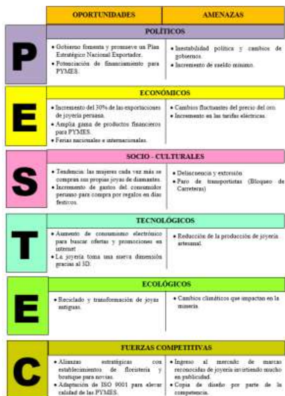
Fig.6. Análisis de Macro Entorno (PESTE-C) Elaboración propia

Mediante el Análisis de Macro Entorno (PESTE-C) en la Figura 6 se identifican los aspectos externos como las oportunidades y amenazas de las fuerzas políticas, económicas, social, tecnológico, ecológico y competitiva.