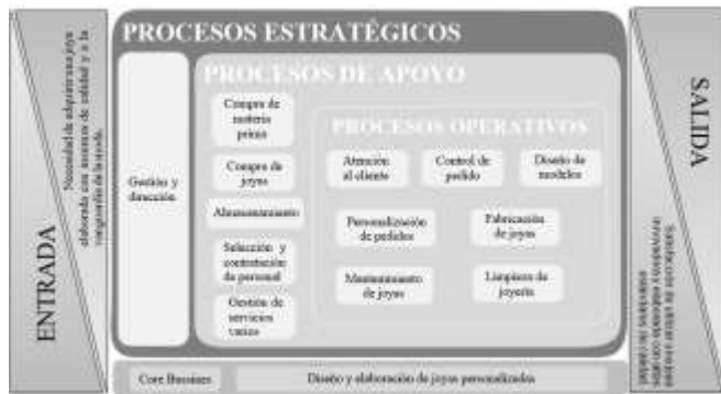
Fig.4. Mapa de procesos Elaboración propia

También, en la Figura 4 se realizó el mapa de procesos , el cual permitió visualizar de acuerdo a los niveles de la organización los procesos involucrados.