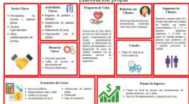
Fig.2. Modelo de canvas