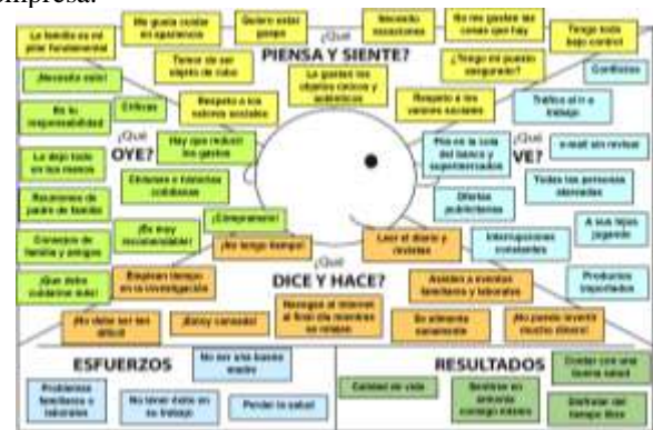
Fig.1. Mapa de empatía

Ambas figuras permiten determinar la etapa filosófica de la empresa.