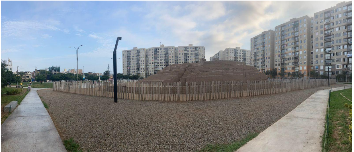
Huaca Huantinamarca alrededor de los condominios Parques de la Huaca