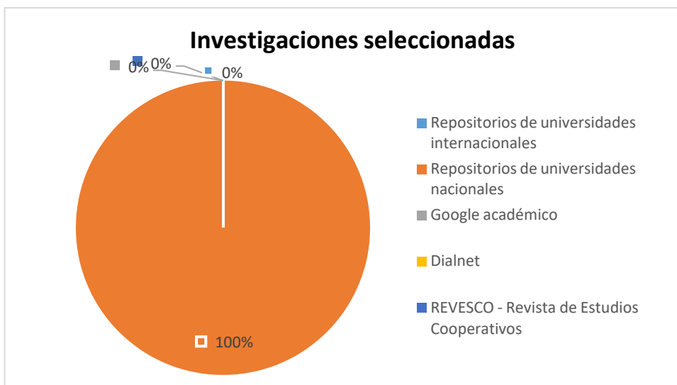
figura 2. Análisis de artículos finales después de la revisión

En la figura 2 se aprecia que todas las investigaciones que fueron seleccionadas, es decir el 100%, equivalente a 4 investigaciones, provienen de repositorios nacionales, ello se debería a que dentro de los criterios de inclusión se establecía seleccionar a las investigaciones realizadas en Perú.