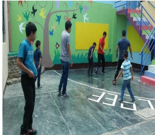
Figura 03: Ejecución de dinámicas en el patio del CAEF.