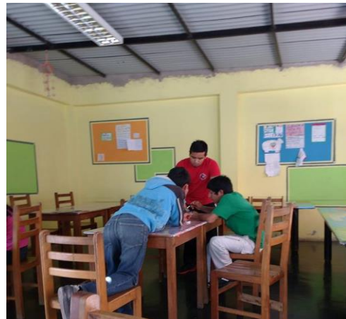
Figura 04: Asesoría en tareas escolares