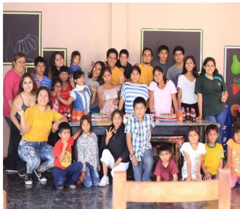
Figura 05: Último taller con los niños del CAEF.