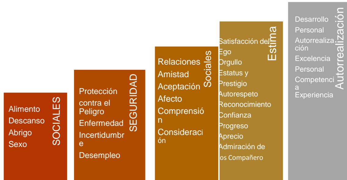
Figura 1 Necesidades de Maslow