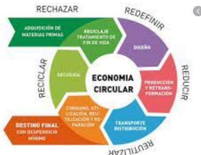
Figura 2. Economía Circular. Pearce y Turner (1990)

Según Fundación Ecolec (2004). La economía circular intenta reutilizar los materiales al final de su vida útil y realiza procesos de regeneración y reciclaje de la forma más respetuosa con el medio ambiente. Por tanto, en este modelo se priorizan los beneficios económicos, sociales y ambientales y están estrechamente vinculados a la sostenibilidad.