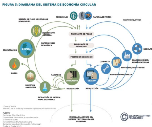
Figura 1. Diagrama Sistemático. Ellen MacArthur (2012).

financiero, manufacturado, humano, social o natural. Esto garantiza flujos mejorados de bienes y servicios. El diagrama sistémico presenta el flujo continuado de materiales técnicos y biológicos mediante el 'círculo de valor'.