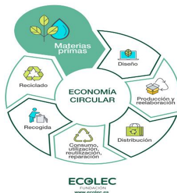
Figura 3. Fundación Ecolec (2004)

La expresión fue acuñada por su creador, Elías St. Elmo Lewis en 1898. Lewis era vendedor de varias empresas y estaba interesado en cómo mejorar las ventas. Adoptó esta técnica para descubrir cómo se relacionan entre sí los distintos agentes involucrados en las ventas, como la relación entre un vendedor y un comprador con respecto a la compra de un artículo en particular.