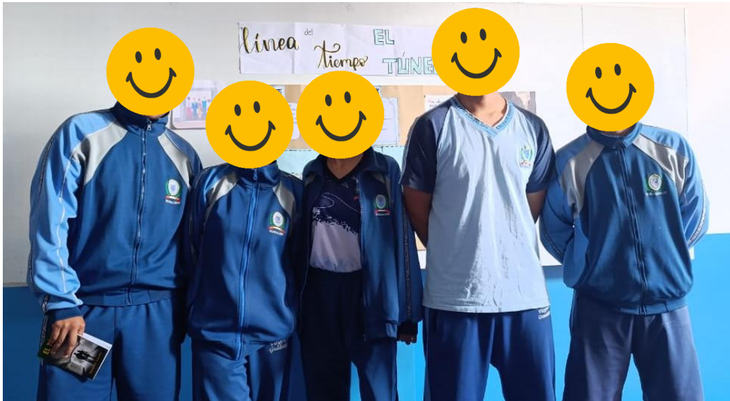
Taller de orientación vocacional