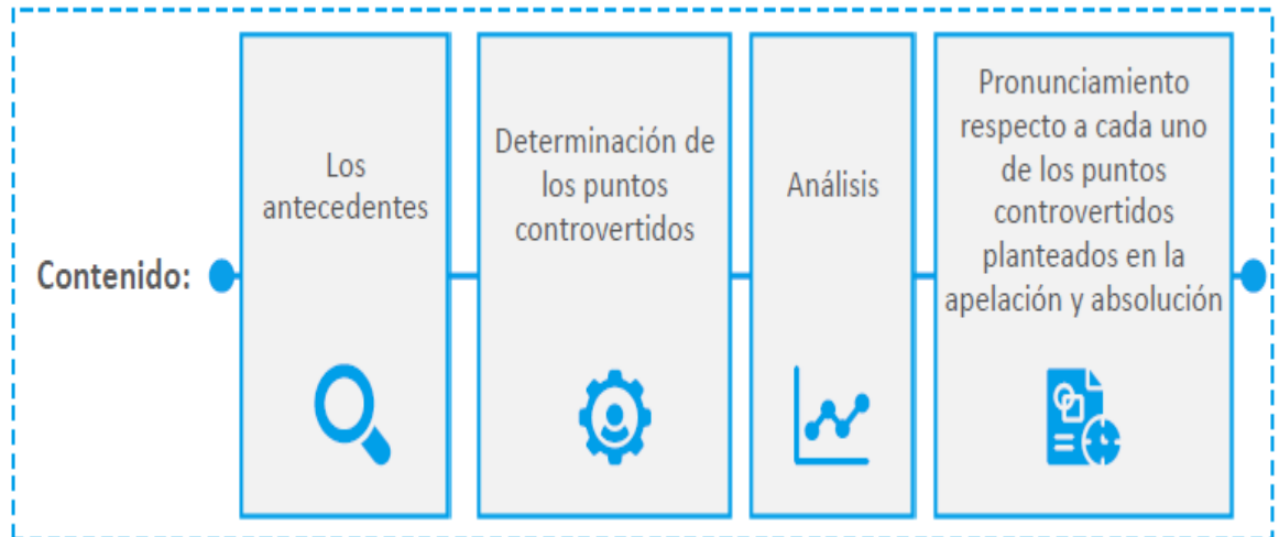
Fig. N° 3 Contenido de la Sentencia del Tribunal de Contrataciones. Fuente Escuela Nacional de Control

En cuanto a la Resolución que emita el Tribunal de Contrataciones, Solo se pronunciará respecto de los hechos y pretensiones planteadas en el recurso de apelación y en la respectiva absolución