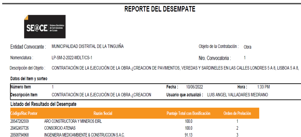
Figura 5: Reporte de desempate del SEACE

Constructora y Mineros E.I.R.L., obtuvo el primer lugar en el orden de prelación (ver figura 2)