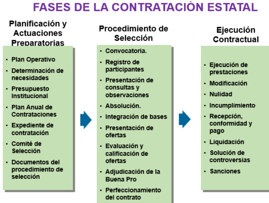
Figura N° 01 Fases de la Contratación Estatal, Elaboración propia

Se desarrolla mediante un proceso integral a lo largo de tres fases que se grafican: