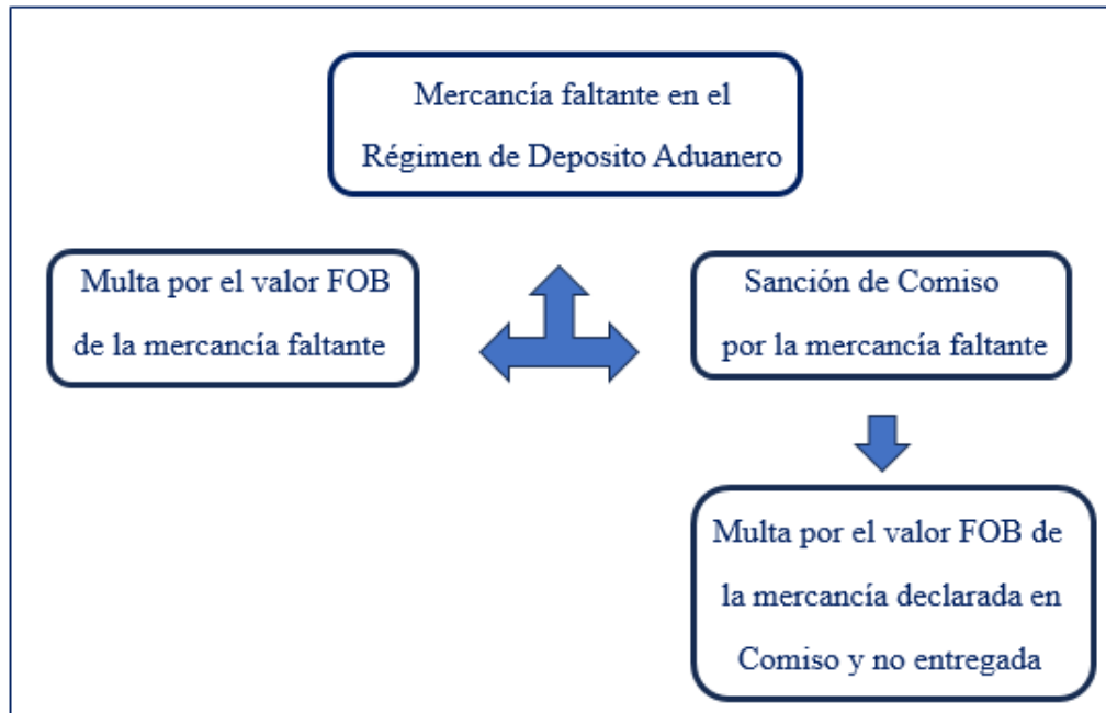
Figura N° 2: Esquema de las multas aplicadas por Mercancía Faltante en el Régimen de Depósito