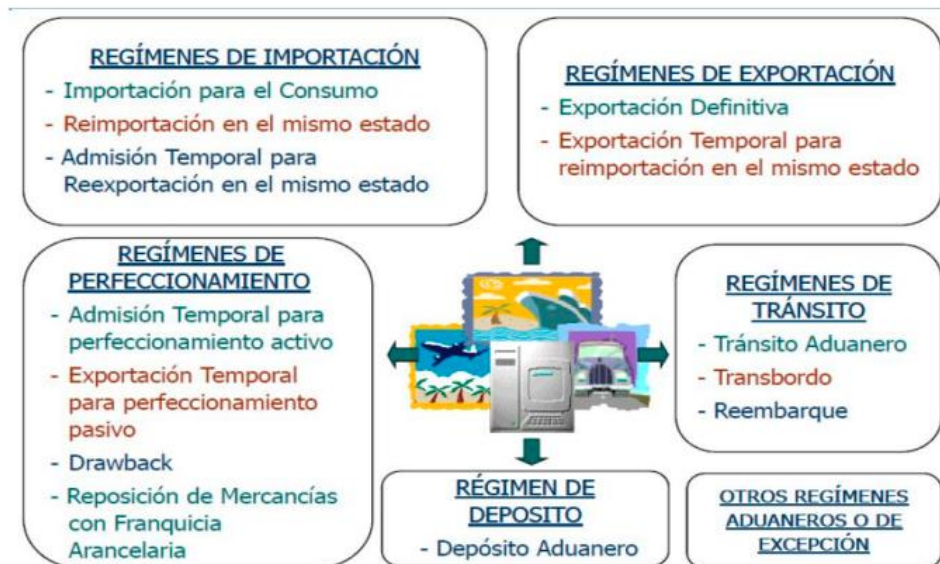
Figura N° 4: Regímenes Aduaneros aprobados por SUNAT