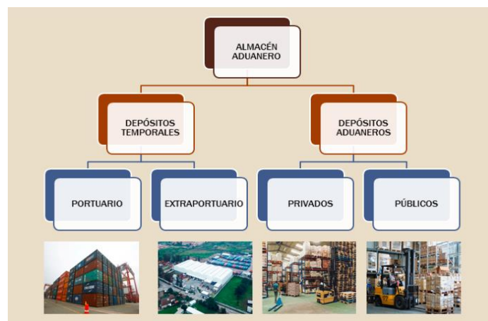
Figura N° 6: Diagrama de Almacenes Aduaneros aprobados por SUNAT