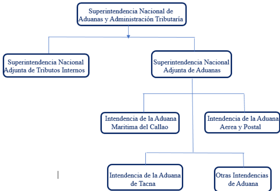
Figura N° 1: Organigrama SUNAT