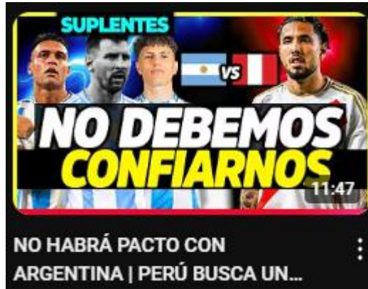
Figura 7: no habrá pacto con argentina | Perú busca un milagro para clasificar | copa américa