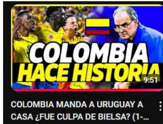
Figura 20: Colombia manda a Uruguay a casa ¿fue culpa de Bielsa? (1-0) | victoria con 10 jugadores