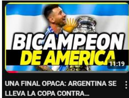
Figura 22: una final opaca: Argentina se lleva la copa contra Colombia (1-0) | el adiós de Messi