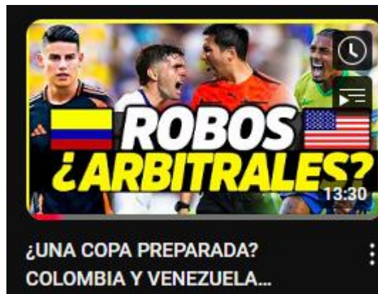
Figura 13: ¿una copa preparada? Colombia y Venezuela dominan | México y Estados Unidos afuera