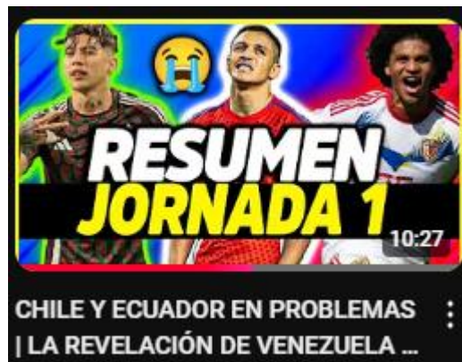
Figura 2: Chile y Ecuador en problemas | la revelación de Venezuela | análisis copa américa