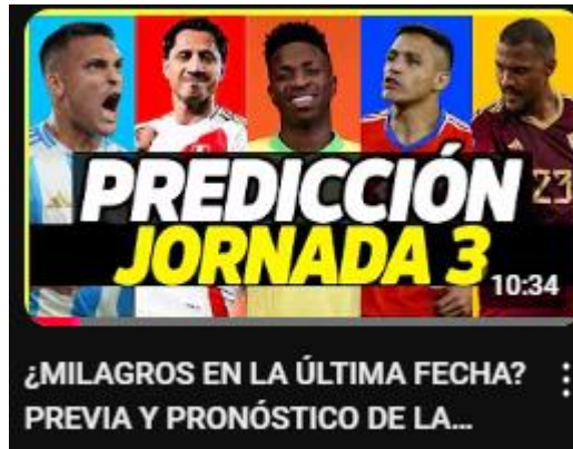
Figura 8: ¿milagros en la última fecha? previa y pronóstico de la fecha 3 | análisis copa américa