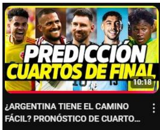
Figura 14: ¿argentina tiene el camino fácil? pronóstico de cuartos de final | análisis copa américa