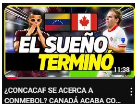
Figura 16: ¿Concacaf se acerca a Conmebol? Canadá acaba con el sueño chamo (1-1) | copa américa