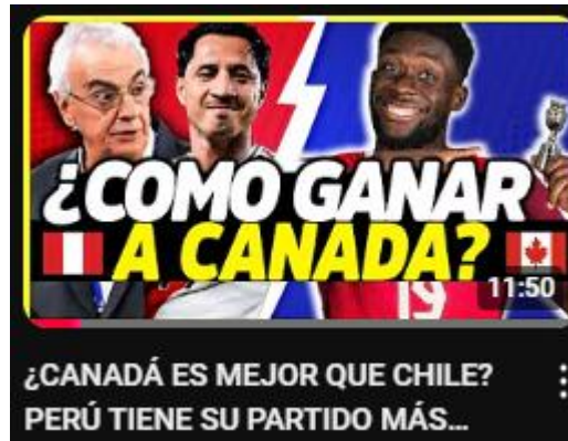
Figura 3: ¿Canadá es mejor que Chile? Perú tiene su partido más importante | análisis y previa