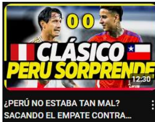
Figura 1: “¿PERÚ NO ESTABA TAN MAL? SACANDO EL EMPATE CONTRA CHILE Y GARECA | ANÁLISIS COPA AMÉRICA”