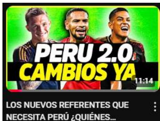
Figura 12: los nuevos referentes que necesita Perú ¿quiénes merecen la confianza? | opinión