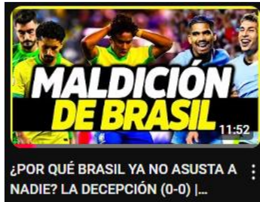
Figura 17: ¿Por qué Brasil ya no asusta a nadie? la decepción (0-0) | Uruguay quiere la copa américa