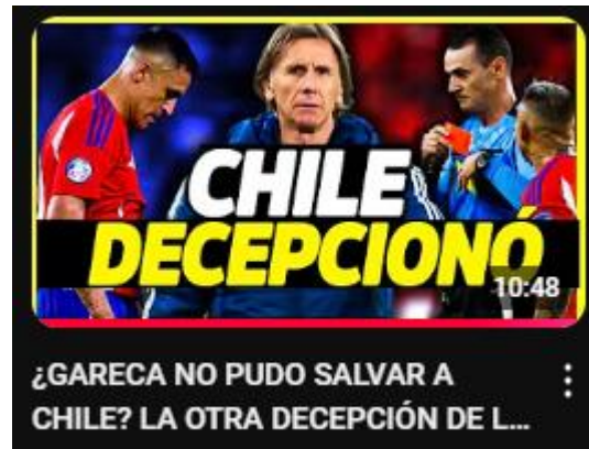
Figura 10: ¿Gareca no pudo salvar a Chile? la otra decepción de la copa américa | análisis y opinión