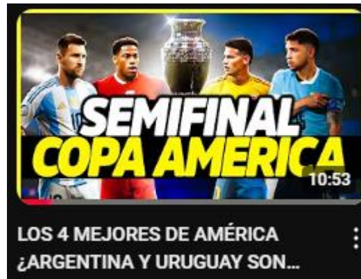
Figura 19: Los 4 mejores de América ¿Argentina y Uruguay son fijos? | predicción de semifinales