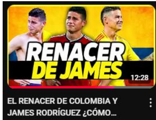
Figura 21: el renacer de Colombia y James Rodríguez ¿cómo levantarte cuando tocas fondo? | opinión