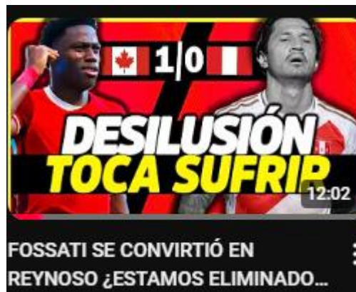
Figura 4: fossati se convirtió en reynoso ¿estamos eliminados de la copa? | derrotados por Canadá