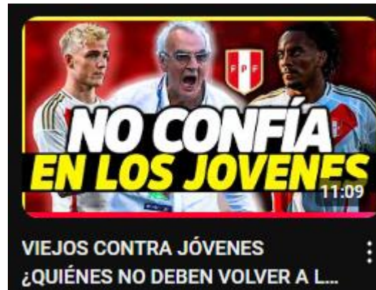
Figura 5: viejos contra jóvenes ¿Quiénes no deben volver a la selección? | el problema de Fossati