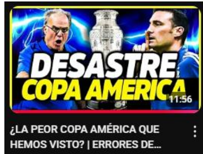
Figura 23: ¿La peor copa América que hemos visto? / errores de Conmebol y la organización / opinión