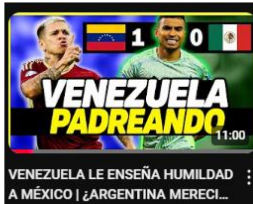
Figura 6: Venezuela le enseña humildad a México | ¿argentina mereció ganar contra chile? | análisis