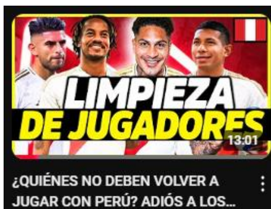
Figura 11: ¿Quiénes no deben volver a jugar con Perú? adiós a los de siempre | selección peruana