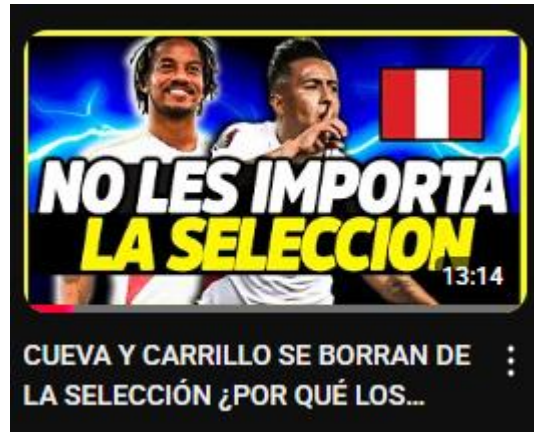
Figura 18: Cueva y Carrillo se borran de la selección ¿por qué los peruanos son juergueros? | opinión