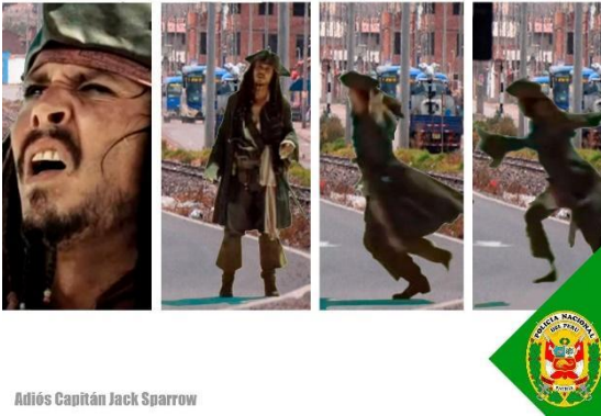
Adiós Capitán Jack Sparrow

Así te ves “Cuando no usas el puente peatonal”