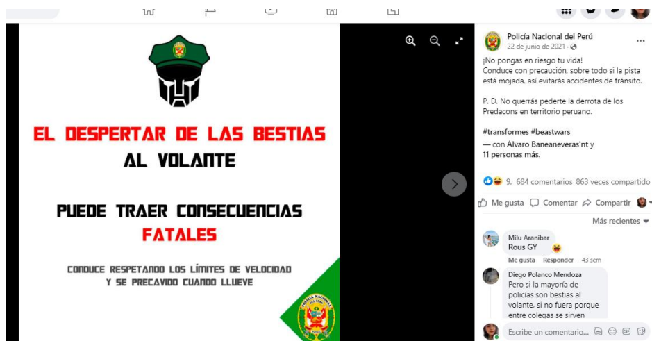
Figura 7 Meme sobre la prevención de accidentes de tránsito

Nota: Se analizaron las imágenes de la PNP entre los años 2020 y 2022 para poder identificar sobre qué tema refleja, si promueve alguna prohibición, que actores participan y con que esquema narrativo se expresa.