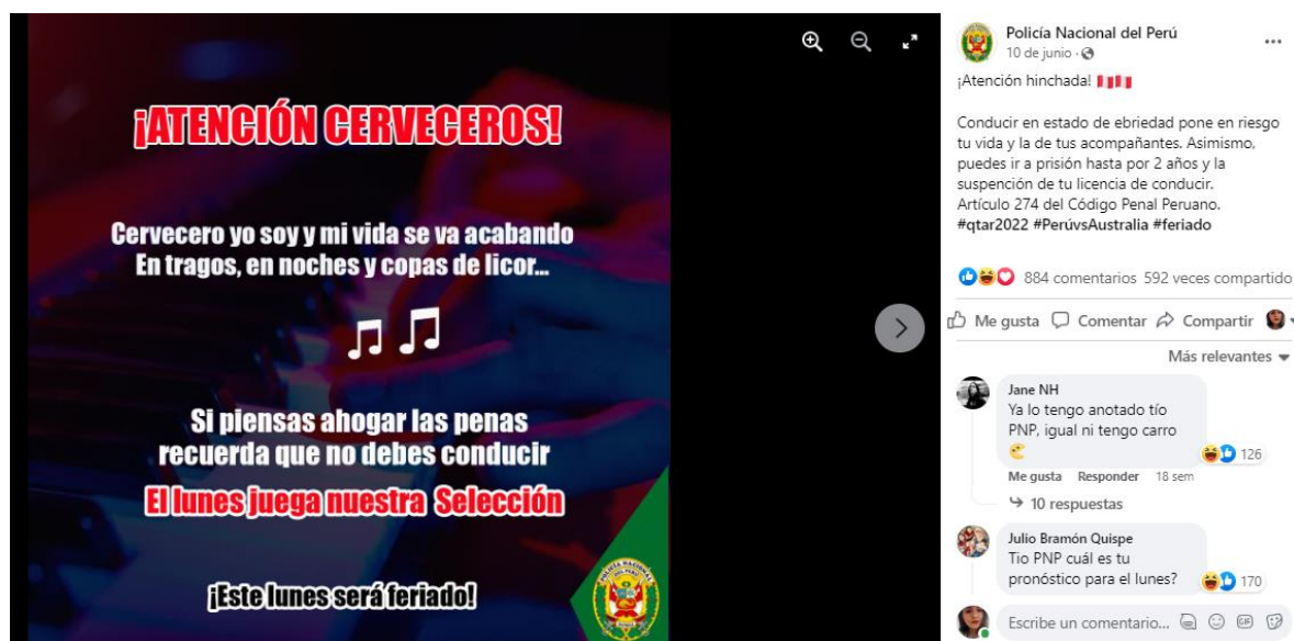
Figura 8 Meme sobre la prevención de accidentes de tránsito

Nota: Se analizaron las imágenes de la PNP entre los años 2020 y 2022 para poder identificar sobre qué tema refleja, si promueve alguna prohibición, que actores participan y con que esquema narrativo se expresa.