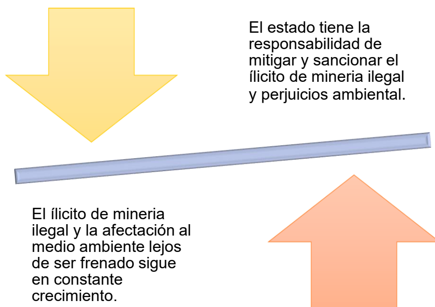
Figura N°2: Responsabilidad que tiene el estado de fiscalizar y erradicar las minerías ilegales y sus daños ambientales causados.