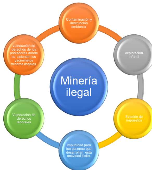
Figura N°3: Consecuencias negativas que acarrea la minería ilegal.

Ante estas ideas, es importante resaltar el grado de incidencia que tiene la minería ilegal, pues con el transcurso del tiempo, se ha convertido en un mal que va en aumento y no se logra erradicar, por falta de presencia e incluso el abandono total en el que se encuentran las comunidades alejadas, mientras no se ejecuten las medidas necesarias por el estado y empiecen a tomarle la importancia debida al problema y la atención a estos pueblos, no se logrará la erradicación de este problema, sino por contrario solo avanzará y terminará con todo a su paso.