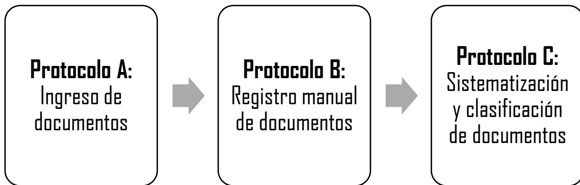
Figura 2. Protocolos de recepción documental

A continuación, presento un diagrama de procedimientos que muestra el funcionamiento de las etapas del procesamiento documental, así como el desarrollo de los protocolos que se siguen para lograr el correcto procesamiento de los documentos.