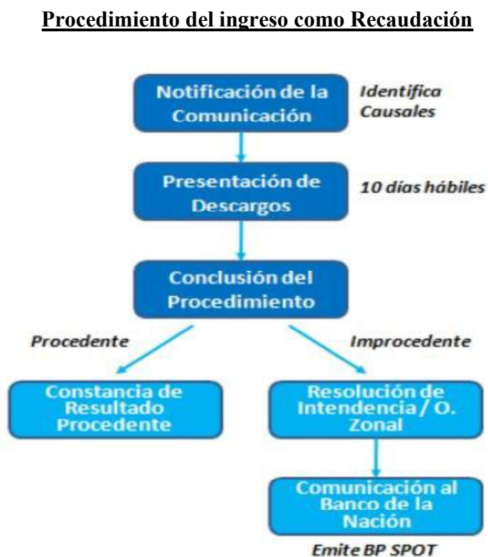
Figura 9: Procedimiento del ingreso como recaudación

Para el caso de la empresa en cuestión no se interpuso el recurso de reconsideración menos la apelación, porque consideraban que la SUNAT ya había realizado el ingreso como recaudación. Y hacer valer los derechos vulnerados equivalía a invertir tiempo y dinero en vano.