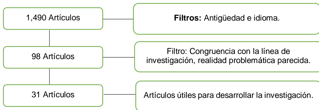
Figura 1: Proceso de codificación

Finalmente, se llegaron a examinar los distintos instrumentos empleados en conjunto con la unidad de análisis.