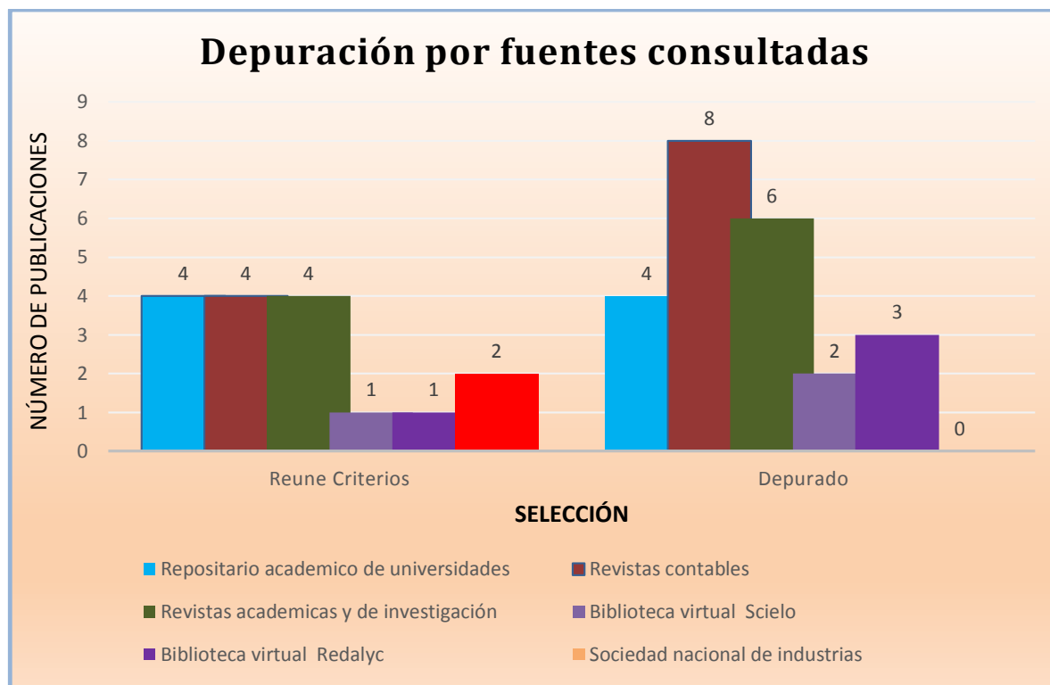
Gráfico 01. Artículos descartados por repetición en las fuentes de publicaciones consultadas.

En el Gráfico 1, se puede distinguir que de las 39 publicaciones que pasaron por la primera depuración, solamente 16 de ellas reúnen y cumplen con los criterios de exclusión declarados en el presente trabajo.