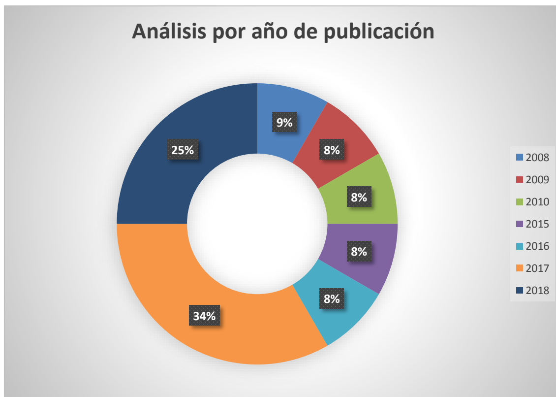
Gráfico 04. Análisis por año de publicación

En el Gráfico 04 se puede observar que los años 2017 y 2018 contienen el mayor porcentaje de las publicaciones, 34% y 25% respectivamente, lo cual nos indica que nuestro objetivo de investigación actualmente viene siendo bastante estudiado y es de actual preocupación y pertenece a la coyuntura científica y académica actual.