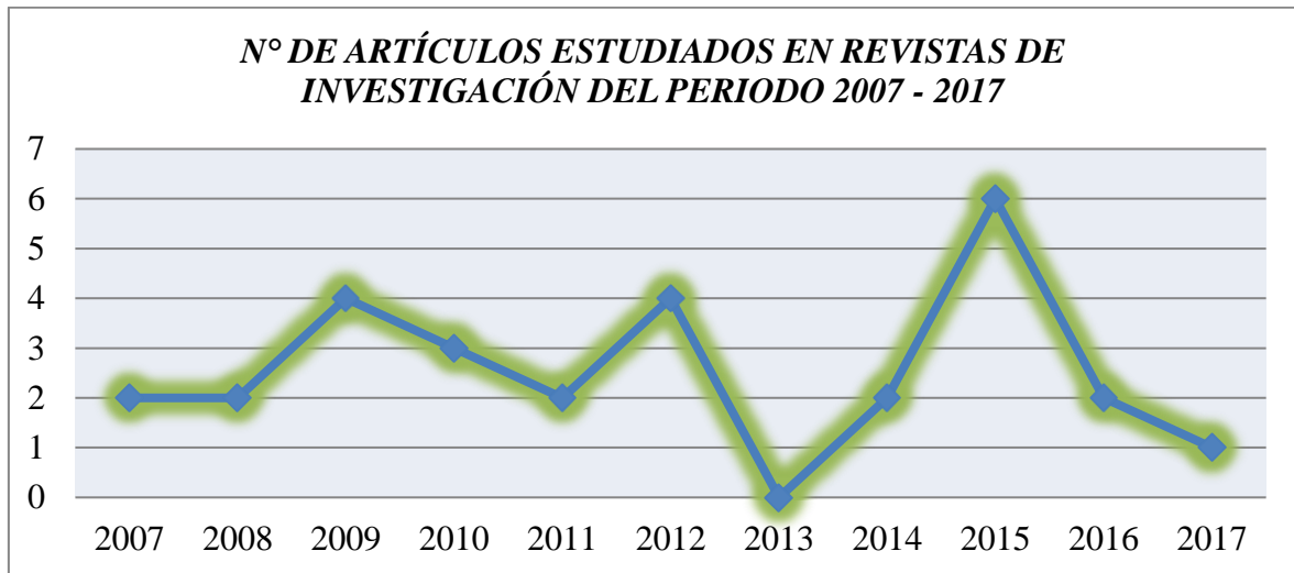
Figura: (Elaboración propia)

En la figura se muestra que en el año 2015 se encontró mayor número de artículos tomados para la investigación en las diferentes bases datos frente a 1 artículo en el año 2017. En el año 2013 no se estudió ningún artículo relacionado al tema a investigar.