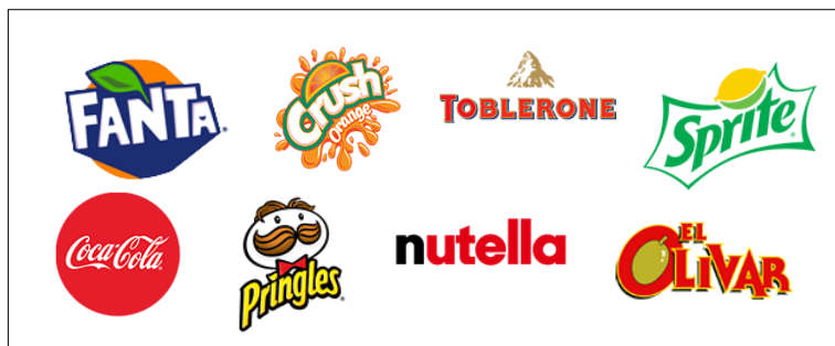
Figura 2: Principales marcas.