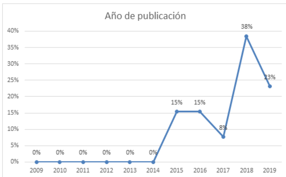
Figura 2. Porcentajes de artículos por año de publicación