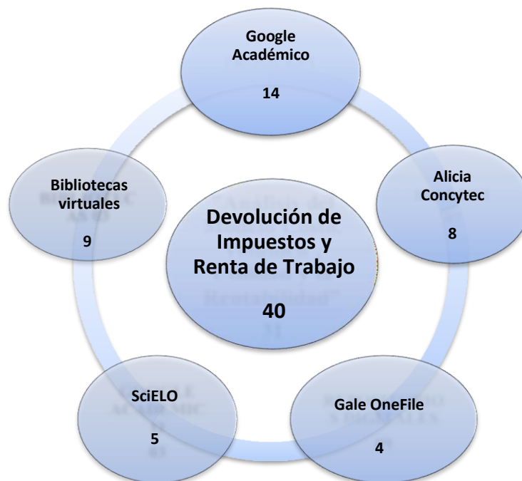
Figura N° 01: Cantidad de artículos encontrados.

El seguimiento de información en las bases de datos me dio un total de cuarenta estudios conformados por tesis, artículos, decretos, revistas y repositorios digitales, las cuales fueron encontradas en diversas fuentes, aquella información encontrada cumple con los estándares mínimos de calidad. (Figura N° 01)